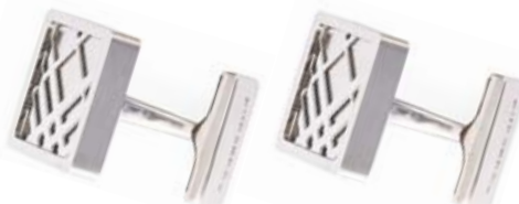
Butoni BURBERRY, 780 lei