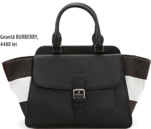
Geantă BURBERRY, 4480 lei