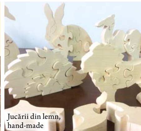
Jucării din lemn, hand-made