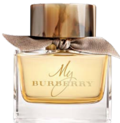
Parfum MY BURBERRY, 447 lei