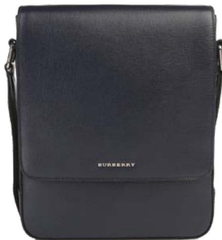
Geantă BURBERRY, 5380 lei