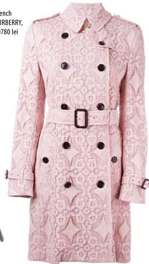
Trench BURBERRY, 10780 lei