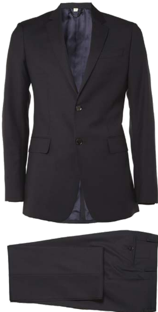
Costum BURBERRY Tailoring, 6975 lei