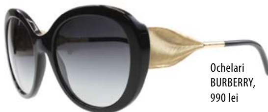
Ochelari BURBERRY, 990 lei