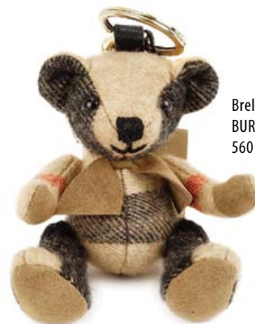
Breloc BURBERRY, 560 lei