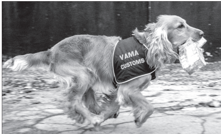
Unul dintre câinii donăți de JTI.