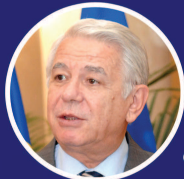
TEODOR MELESCANU, MINISTRUL AFACERILOR EXTERNE:

“Franța reprezintă pentru noi nu numai un partener strategic de încredere, dar și un adevărat prieten al României, relația dintre țările noastre cristalizându-se și consolidându-se în timp, prin concretizarea unor proiecte în care se regăsesc valori și viziuni comune”.