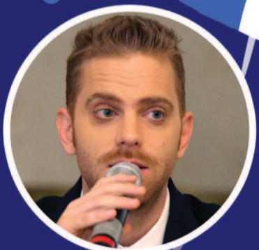
ILAN LAUFER, MINISTRU PENTRU MEDIUL DE AFACERI:

“Ziua de 14 iulie este o dată emblematică nu doar pentru istoria Franței, ci și pentru istoria întregii umanități. Un simbol pentru toate țările democratice, pentru care idealurile de libertate, egalitate și fraternitate răsună în continuare ca un apel la unitate în jurul valorilor democrației și statului de drept”.