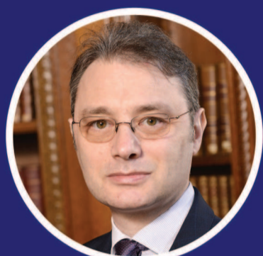
LUCA NICULESCU, AMBASADORUL ROMÂNIEI ÎN FRANȚA:

“Ziua de 14 iulie este o dată emblematică nu doar pentru istoria Franței, ci și pentru istoria întregii umanități. Un simbol pentru toate țările democratice, pentru care idealurile de libertate, egalitate și fraternitate răsună în continuare ca un apel la unitate în jurul valorilor democrației și statului de drept”.