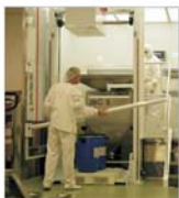
18 mici producători de medicamente vor da faliment