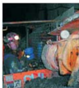
Mierii avertizează guvernul