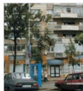
Prețurile apartamentelor au crescut la începutul anului