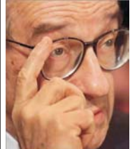
Dolarul a înregistrat cea mai mare creștere din ultimele trei luni în urma deciziilor lui Alan Greenspan, președintele băncii centrale a SUA.

● Oficialii europeni continuă "să sperie" moneda unică