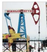
"LUKOIL" - pentru prima oară pe platforma continentală a Kazahstanului