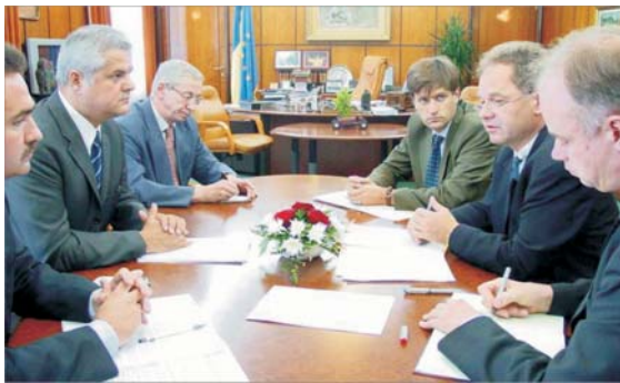
Curtea de Conturi: Executivul ar trebui să respecte cu mai mare strictețe recomandările FMI în privința tarifelor la energie.

● Peste jumătate din agenții economici nu au profit ● Aproape 52% dintre agenții economici au provocat, în 2002, arrierate de 11,6 miliarde de dolari ● FMI are dreptate: prețul la energie nu acoperă costurile de producție ● Tarifele fixate de Guvern la "Tarom" au produs pierderi importante companiei