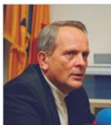
Theodor Stolojan și-a lansat candidatura pentru Cotroceni