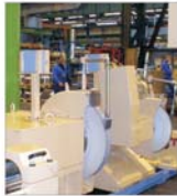
"Someș" Dej a realizat anul trecut vânzări de 40 de milioane de dolari