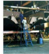
A fost constituită Societatea de Administrare a Parcului Industrial din Mangalia