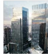
"Time Warner" - pusă sub acuză?