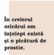
În creierul oricărui om înțelept există și o picătură de prostie.