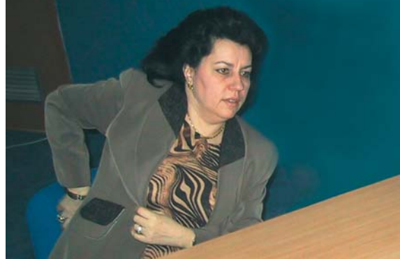
În problema fuziunii celor două piețe, Gabriela Anghelache, președintele CNVM, ține un as în mână.

● Răscumpărarea acțiunilor reziduale și eventualele modificări ale statutelor SIF legate de această operațiune se poate face fără aprobarea AGA ● Diminuarea capitalului social proporțional cu acțiunile răscumpărate conduce la creșterea ponderii în capitalul social al SIF pentru acționarii existenți, chiar la peste 0.1% ● Reducerea numărului de acționari dă posibilitatea întrunirii cvorumului de vot a AGA pentru ridicarea limitei actuale permise în deținerea de acțiuni, de 0,1%