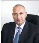
"Tornado Systems" dezvoltă parteneriatul cu "Mortal Networks"