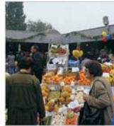
Legislația din domeniul alimentară "ajunge din urmă" acquisul comunitar