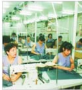
"Asco" Bacău își reorganizează activitatea