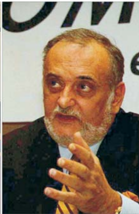
Dinu Patriciu (dreapta), președintele "Rompetrol" ca tot cu datoriile de 621 de milioane de dolari, precizînd că, ulterior, Guvernul Năstase l-a exonerat, iar apoi l-a transformat în obligatîni.