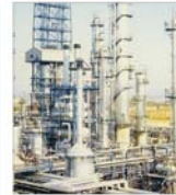
S-a încheiat era petrolului ieftin?