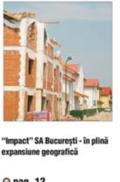
"Impact" SA București - în plină expansiune geografică

Cînd ne-am pierdut totul, inclusiv speranța, viața devine o datorie dizgrațioasă.