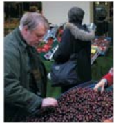
Comerțul cu cireșe aduce un profit de 100% comercianților