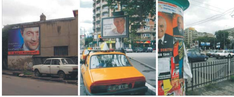
Afisele electorale au tonat simbatic și dominic în Capitală, deși Biroul Electoral Central a avut pretenția să interzică însăși presei să mai publice comentarii electorale în cele două zile.