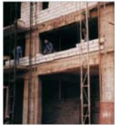
Veniturile "Cemacon" Zăila au crescut cu 67% față de anul precedent