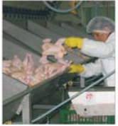
AVE IMPEX a deschis o linie de abatorizare de peste 1 milion de euro