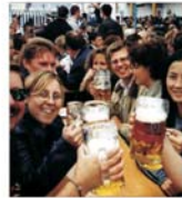
Consumul de bere în acest an: 14 milioane de hectolitri