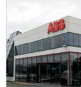
Neregile contabile la o divizie italiană a ABB