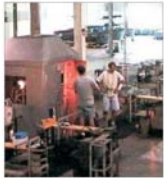
"Cristino" Biștea și-a propus să își tripleze profitul