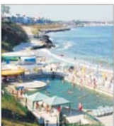
Conducerea societății "Erorie" susține că AGA organizată de mici acționari este ilegală