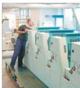
Profitul "Universa" București s-a menținut la nivelul din primul semestru al anului trecut