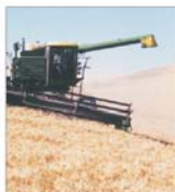
Producție record la grău