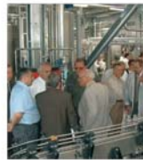
"Tuborg România" va investi circa 10 milioane de dolari în acest an