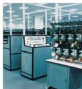
"Aparat Electric" Titu vrea să se orienteze în următorii cinci ani către piața internă