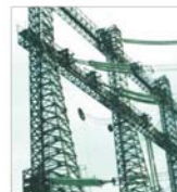
Energia electrică nu se va scumpi în următoarele trei luni