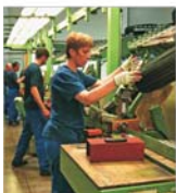
"Continental AP" Timișoara va crește peste 1.200 de locuri de muncă până în 2008