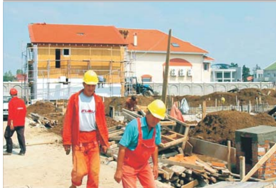
Soldul creditelor ipotecare acordate populației era la sfîrșitul lunii iunie, de circa 650 milioane de euro, potrivit datelor BNR, care iau în calcul doar principalul. Potrivit estimărilor făcute de constructorii și de bănceri (destul de diferite, de altfel) ar însemna că între 100 și 300 milioane de euro din creditele ipotecare au fost destinate construcției sau modernizării de locuințe. Per total, creditele care au finanțat activitatea de construcții nu depășesc 700 milioane de euro. Spre comparație, domeniul construcțiilor a contribuit anul trecut cu aproape 3 miliarde de euro la Produsul Intern Brut (reprezentînd 5,7% din PIB). La finele anului 2003, creditele acordate firmelor de construcții reprezentau doar 1,3% din valoarea adăugată brută creată de acestea. Acest sector a crescut în 2003 cu 7%, mult mai mult decît industria (4,6%), serviciile (5,2%) sau agricultura (3%). Aceeași tendință s-a menținut și în primul trimestru din acest an, cînd domeniul construcțiilor a avansat cu 7,2%, față de 6,6% industria, 5,7% serviciile și 5,4% agricultura.

● Creditele pentru companiile de construcții nu depășesc 700 milioane de euro ● Conducerea "Impact" susține că doar 1,5% din creditele ipotecare finanțează noi construcții ● În replică, președintele ARB, Radu Grațian Ghețea, spune că procentul ar fi mult mai mare