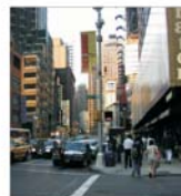
Terorisrul - cea mai mare amenințare pentru economia SUA