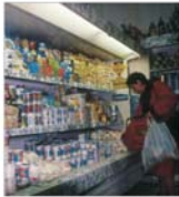
"Bucur": citră de afaceri de 61 de miliarde de lei în primul semestru