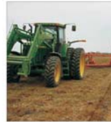
Tranzacțiile cu terenuri agricole înregistrate și dinamizate fără precedent