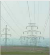
"Transelectrica" și "Fujikura" au semnat un contract pentru finalizarea rețelei de fibră optică