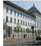
Primăria Timișoara și-a programat investiții de 917 miliarde de lei