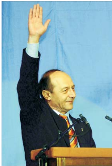
Aveti grijă să nu vi se urce puterea la cap". Președintele ales și-a sfătuit foștii colegi să-și exercite puterea

Într-o ierarhie a discursurilor prezidențiale, cel rostit de Traian Bănescu sîmbătă, la Conferința anuală a PD de la Sala Palatului, ar trebui să ocupe primul loc, așezînd în poziție de inferioritate nu doar pe Ceaușescu, ci și pe Iliescu și Constantinescu. Este, poate, cel mai bun discurs ținut de un politician în istoria țării. Fără nici o hîrtie în față, în vorbire liberă, Traian Bănescu a electrizat publicul timp de mai bine de o oră, etalîndu-și marel talent de comunicator. El a provocat lacrimii la despărțirea de Partidul Democrat, pe care îl părăsește respectînd Constituția care obligă ca președintele țării să nu facă parte din vreun partid: "Îi rog pe foștii mei colegi să nu abandoneze procesul de modernizare a partidului. Dați grîul noi generații de politicieni. Drağii mei, înainte de a ne despărți, să vrea să știți că nu mă aștept să îmi păstreze nimeni locul cald pînă mă întorc de la Cotroceni. Partidul meu avea un ultim moșic, care a plecat mai devreme de termenul stabilit, prin voința poporului".