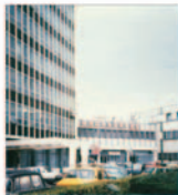
"Iasitex" exportă 90% din producție în întreaga lume