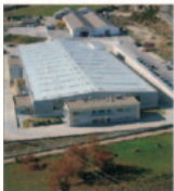
Tunisienii de la "Coficab" și-au finalizat investiția de la Arad