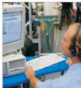
Telecomunicațiile au atras cei mai mari volumi ai investițiilor directe