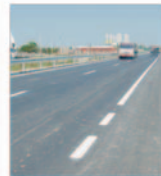
Serviciile pentru realizarea centurii conștanțene au fost scoase la licitație