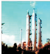
Notorietate aduce propuneri de colaborare societății IPROCHIM București