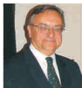
Schimbările comerciale dintre Turcia și România se ridică la 4 miliarde de dolari