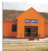
Căminele culturale din județul Arad riscă să devină ruine