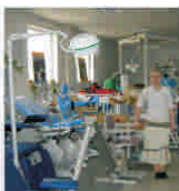
"Adion" își diversifică gama produselor comercializate