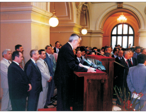
Au toate că a fost formală, inaugurarea, la 21 Iulie 1995 a Burselor de Valori București, a generat speranțe. Timp de 11 ani, însă, n-am fost capabili să o transformăm în barometru al economiei. Măina intrăm în Europa...