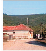
Drumul care traversează Aradul - modernizat din bani europeni