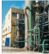
"Azomures" Târgu Mureș a produs peste 460.000 tone ingramășinte chimice, în primul semestru