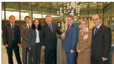
Managementul companiei "A&D Pharma" a fost prezent, ieri, la Londra, la deschiderea tranzacționării acțiunilor la Bursa de Valori din Londra.

Titlurile emise de compania "A&D Pharma Holdings NV" sunt listate, începând de ieri, la Bursa de Valori din Londra.