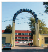
Investiții de 12 milioane de euro la "Faur" București, în următorii trei ani