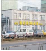
Program de investiții de aproape 2 milioane de euro la "Bermas" Suceava