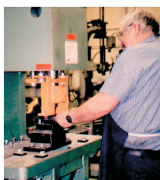
MEBIS și-a propus o creștere cu 12% a profitului