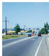
CNADNR licitează lucrări de reabilitare a drumurilor naționale

Invidia implică întotdeauna o inferioritate conștientizată. Pliny