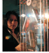
"Motorola" are pierderi de peste 180 de milioane de dolari