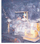
Aproape 500 de mine au fost închise în ultimii zece ani