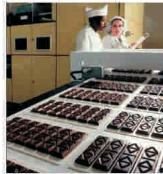
"Cadbury" disponibilizează 7.500 de angajați