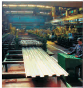
Circa 10 milioane de lei, investiții la "Intfor" Galați