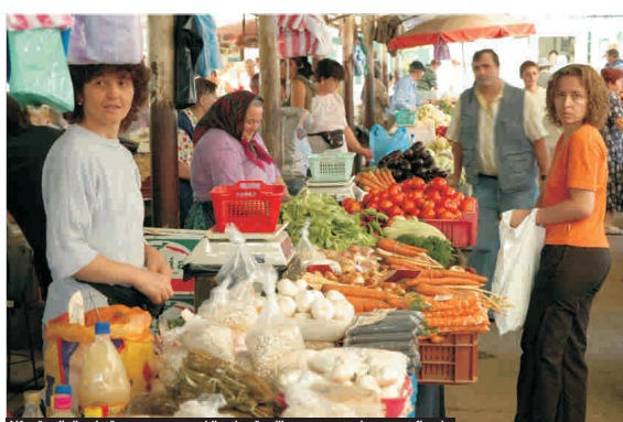
Vânzătorii din piață ar putea avea obligația să utilizeze aparate de marcat fiscale

Prin Ordonanța nr. 47/2007, România face un pas înainte și doi înapoi