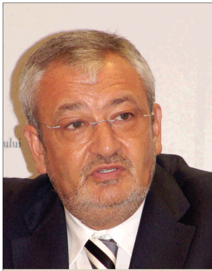
Vlădescu amenință cu demisia, dacă Parlamentul va vota măsuri care pot provoca dezechilibre bugetare.

● Peste 2.000 de amendamente depuse ● Delegația FMI sosește la București pe 26 ianuarie