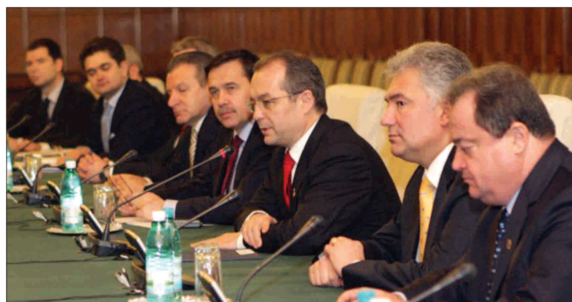
Ultimele evenimente de la Roșia Montană arată că Guvernul s-a pripit, în decembrie, când a inclus proiectul în programul de guvernare.

Oficiul Registrului Comerțului a respins înregistrarea majorării de capital de la Roșia Montană Gold Corporation, operațiune care era vitală pentru salvarea societății de la dizolvare Roșia Montană Gold Corporation nu a făcut recurs la hotărârea județatorului delegat, ceea ce împinge compania, conform legii, în pragul dizolvării