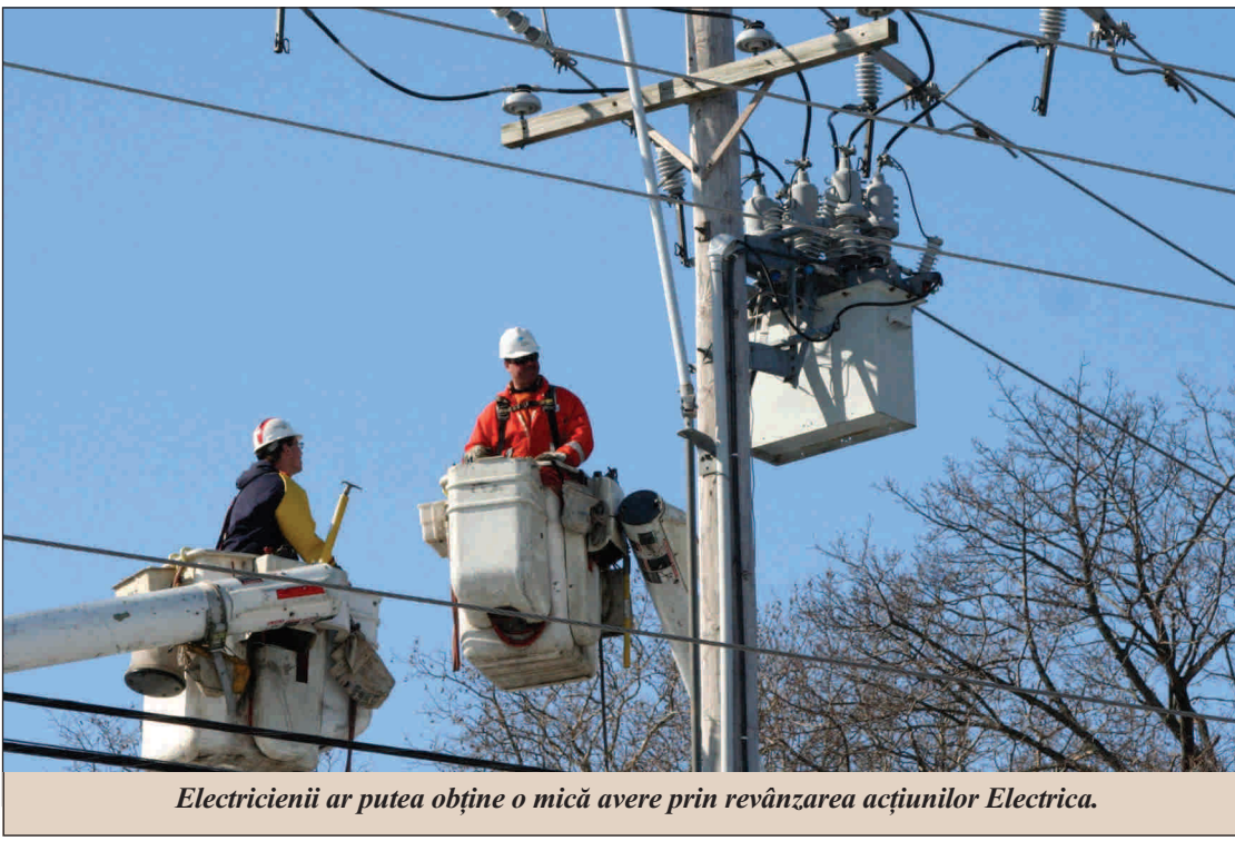
Electricienii ar putea obține o mică avere prin revânzarea acțiunilor Electrica.