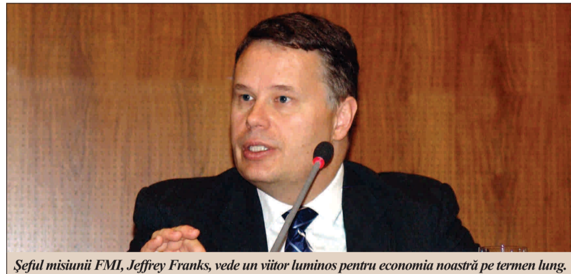
Șeful misiunii FMI, Jeffrey Franks, vede un viitor luminos pentru economia noastră pe termen lung.

Jeffrey Franks: Da. Sunt convins de asta. Cred că, dacă măsurile de austeritate pentru reformarea sistemului public vor continua, România va intra în anul 2011 cu o poziție fiscală mai bună, cu niște reforme structurale importante, care au fost deja im-