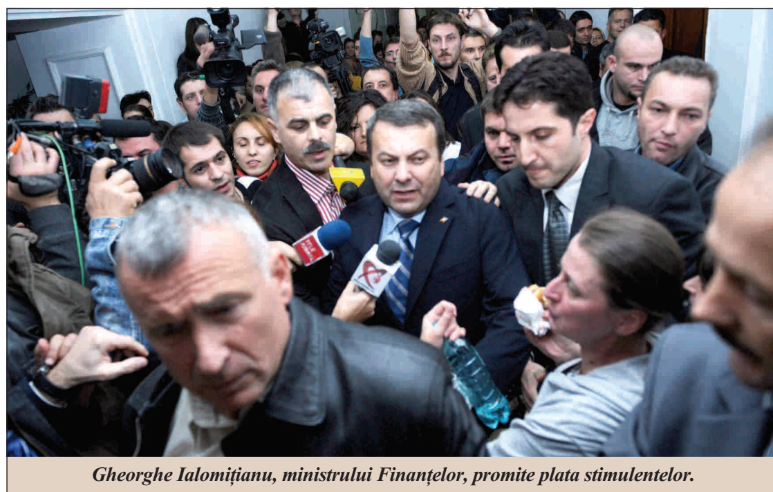
Gheorghe Ialomițianu, ministrul Finanțelor, promite plata stimulentei.

Proteste de bugetarilor din Finanțe reprezintă încă o bilă neagră pentru țara noastră în ochii analizatorilor străini, care deja au început să dea pronostici pesimiste.