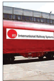
două fonduri de investiții și sperăm să putem finaliza planurile de restructurare în aprilie".