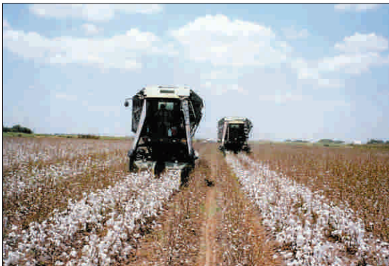
și "Tuvic Impex SRL".

Guvernul nostru a organizat, după semnarea acordului, o licitație în urma căreia a desemnat cinci societăți comerciale să realizeze importurile de bumbac: "Românexpo SRL", "Tricornom SA", "Textilotton SA", "Implex Overseas Corp SRL"