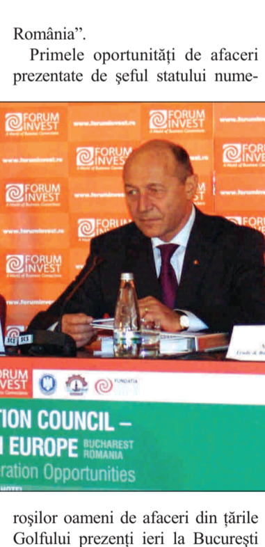
roșilor oameni de afaceri din țările Golfului prezenți ieri la București

În țara noastră se poate investi eficient în orice domeniu pentru că avem un decalaj de dezvoltare față de Europa de Vest, a declarat ieri președintele Traian Bănescu, în deschiderea Forumului „Consiliul de Cooperare a Golfului – Europa de Sud Est - Oportunități de afaceri”, eveniment organizat de Forum Invest. Domnia sa a precizat că acest decalaj de dezvoltare nu poate fi acoperit numai cu resurse de la bugetul de stat și din fonduri europene, ci și atrăgând investiții străine: „Nu avem un mediu de afaceri ostil, iar investițiile străine în România sunt garantate. Firmele străine înregistrate în România pot cumpăra terenuri. Noi vom simplifica în continuare legile care au proceduri mult prea birocratice și invităm investitorii din țările Golfului să facă profit în orice domeniu pe care îl consideră interesant în