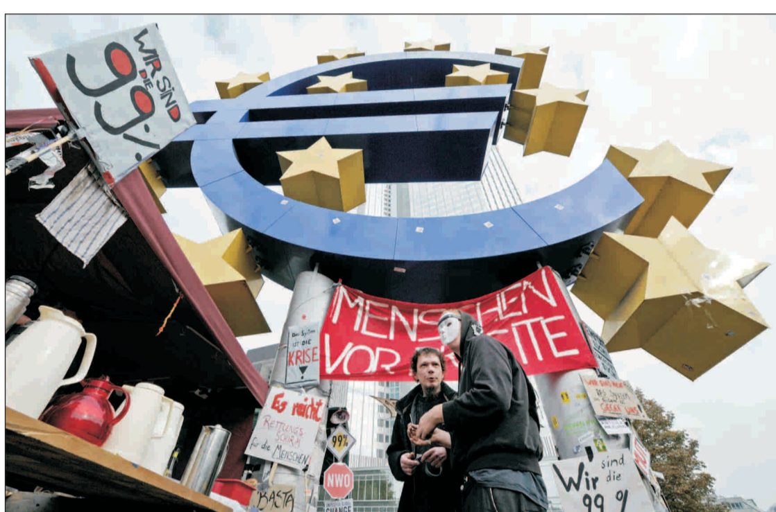
Demonstrații din Mișcarea "Occupy Wall Street" au continuat pentru a treia zi protestele în fața Băncii Centrale Europene din Frankfurt.

Planul integral a fost lasat în responsabilitatea Reuniunii UE din finalul acestei săptămâni.