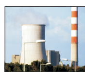
ci dorește să salveze compania", mai susțin sursele noastre, care estimează la 300 milioane de euro necesarul investițional pentru modernizarea centralelor și a minelor. (A.T.)

Departamentul pentru Energie a anunțat că așteaptă scrisori de interes din partea investitorilor pentru privatizarea Complexului Energetic Hunedoara, care este cel mai ineficient producător de energie, cu multe obligații de plată, în ciuda faptului că statul i-a sters o parte importantă din datorile istorice. Surse apropiate situației ne-au declarat că metoda de privatizare aleasă ar fi aport de capital social pentru o majorare, investitorul privat urmând să capete controlul a 51% din companie. „Toți așteaptă bani merg numai la investiții. Statul nu încasează nimic,