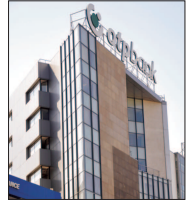
diafax, decizia fiind luată ca reacție la intrarea în vigoare a Legii dării în plată. (E.O.)

Aproape jumătate din sistemul bancar românesc, respectiv 15 bănci din cele 36 care activează în țara noastră, au majorat avansurile solicitate pentru acordarea creditelor ipotecare, în contextul Legii dării în plată.