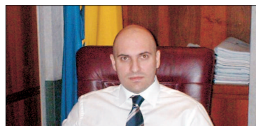
Reporter: Cum a evoluat piața de avocatură în acest an, comparativ cu anul trecut?

PSD a prezentat un Program electoral cu obiective dorite fiebinte de medii de afaceri, bine articulată, cu evaluări cantitative și esalonat pe termene scadente precis definite. I-am apreciat Programul, pentru că m-am gândit că, deși nivelul de înșelare pe genunchi (cum s-a prezentat ceilalți) și cum este tradiția noastră, indiferent că doar minte electorală, dă o lecție celorlalte partide, pentru totdeauna, cum să se prezinte la alegeri, cum să-și respecte cetățenii și cum arată respectul de sine al unui partid.