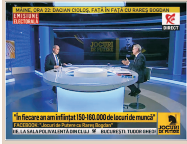
Dialog Liviu Dragnea - Rareș Bogdan, Emisiunea “Jocuri de putere” din 7 decembrie 2016

Liviu Dragnea: Este pentru prima dată când, într-adevăr, un partid vine cu un program de guvernare care nu conține declarații politice, ci fapte va fi în Parlament, dacă noi vom câștiga, fără nici o modificare. Rareș Bogdan: Dumneavoastră vă așumăm că toate măsurile pe care le-ați enunțat în această campanie, atât astăzi în conferința de presă, cât și în urmă cu o lună de zile, vor fi aplicate în România? Liviu Dragnea: Dumneavoastră vă așumăm că toate măsurile pe care le-ați enunțat în această campanie, atât astăzi în conferința de presă, cât și în urmă cu o lună de zile, vor fi aplicate în România? Rareș Bogdan: Dumneavoastră, fără il aplicați, cu absolut tot... reduceri de taxe...? Liviu Dragnea: Aia (în r., programul electoral) va fi aprobat de Parlament. Vi-las dumneavoastră. Rareș Bogdan: Exact așa?