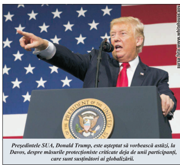
Președintele SUA, Donald Trump, este așteptat să vorbească astăzi, la Davos, despre măsurile protecționiste criticate deja de unii participanți, care sunt susținători ai globalizării.

Forumul de la Davos din acest an a "demarat" greu, pe fondul căderilor masive de zăpadă, care au întârziat sosirea participanților. Institutul pentru studiul zăpezii și avalanșelor din Davos a transmis un avertisment de nivel 5, cel mai mare pe o scală de la 1 la 5, cu privire la pericolul avalanșelor de zăpadă, după cum scrie Reuters. CALIN RECHEA În ceea ce privește pericolul unei "avalanșe" financiare, elitele politice și financiare invitate la Forum nu par să manifeste o teamă vizibilă. Nici nu este de mirare, deoarece pericolul "îngropării" sub pământ a pieței prețurilor există, în condițiile în care plătitorii obișnuiți de taxe sunt obligați să poarte povara.