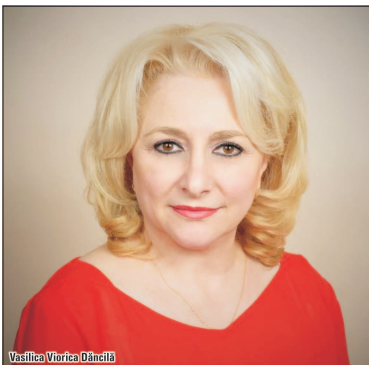
Vasilică Viorica Dăncilă

Câte unul din fiecare țară membră a Uniunii Europene, Comisia numără 28 de comisari. Câte unul din fiecare nu-știu-ce, Guvernul PSD-ALDE numără 28 de miniștri. Nouă femei în Comisia Europeană 2014. Nouă femei în ediția a III-a a guvernului PSD-ALDE, 2018. Din acest punct de vedere, Guvernul nostru pare capabil să conducă Europa. Ceea ce nu este pur și simplu bășcălie, pentru că, de exemplu, nici pe Jean-Claude Juncker nu l-a preocupat prea mult competența comisarilor, ci sexul lor l-a făcut mai tare.