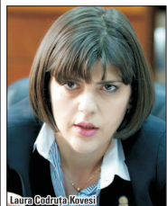
Laura Codruța Kovesi

■ Kovesi: "Motivete invocate sunt neareale și netemeinice"