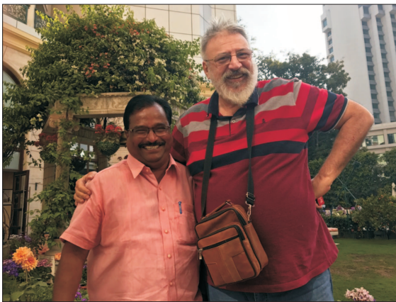
Make, cu amicalul său indian, în India

N ew Delhi, 4 martie, 2017. Mă aflu în grădina hotelului Royal Plaza, vecin cu masa unui grup de indieni, probabil hinduși, două femei în saruri colorate și doi bărbați, cu toții cam pe la cincizeci de ani. Mă certea-