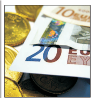
AURELIAN DOCHIA: "Va fi foarte greu să mai funcționeze piața neperformanțelor dacă apare o nouă criză"