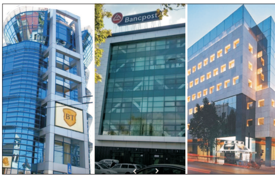
Banca Transilvania nu a preluat și creditelor cesionate de Bancpost către Eurobank.

M ulți dintre debitorii împrumutați în franci elvețieni (CHF) la Bancpost au decis să suspende plata ratelor până când va fi clarificată situația creditelor cesionate în alte țări. Unul dintre clienții ne-a transmis: "Mie banca mi-a cesionat creditul, care nu avea restanțe, de două ori, fără să mă notifice. Inițial a fost cesionat în 2008, la un an de la semnarea contractului, dar am aflat târziu, în 2015. Notificările au venit abia acum. Eu am făcut o sesizare către Bancpost în care cer toate documentele care stau în spatele celor două cesionări - cesiune contract Bancpost - ERB NEW Europe Funding II BV și Bancpost - ERB - EUROBANK ERGASIAS SA. Solicit de la Eurobank și notificarea serviciilor transmise BNR, precum și traducerea în limba română. Eu am încheiat un contract, doar cu Bancpost. În această situație, am decis să suspend plata ratelor până la prima cerere a acestor documente, așa cum prevede art. 1578 alin. (4) și (5) din Codul civil. Am luat legătura cu mulți debitori, și ei fac același lucru. Nu vom mai plăti ratele până la clarificarea situației". Acesta hotărâre a debitorilor în moneda elvețiană vine după confirmarea că împrumuturile cu plata în CHF cesionate de Bancpost unei entități din Olanda vor rămâne la Eurobank după ce Banca Transilvania (BT) a achiziționat Bancpost. Consumatorii aflați în această situație sunt în incertitudine,