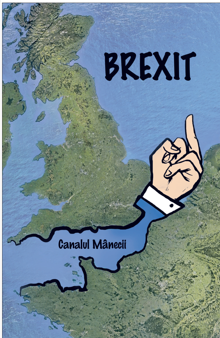
Ilustrație de MAKE și Oana B., preluată din publicația BUCUREȘTI HEBDO

● Jeremy Corbyn, liderul opoziției din Marea Britanie: "Un al doilea referendum pentru Brexit nu este o opțiune pentru prezent"