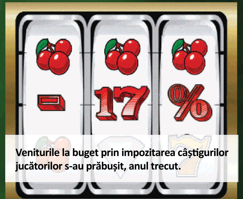
Evoluția sectorului de jocuri de noroc