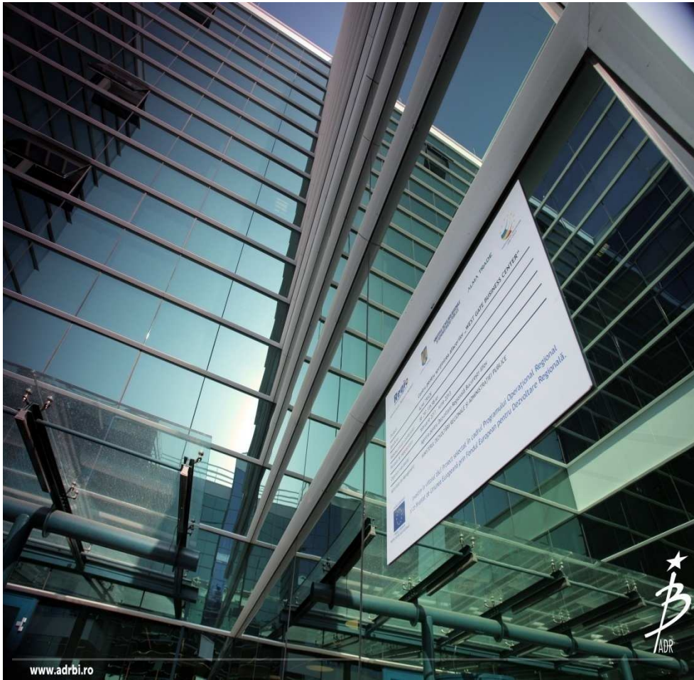
Centru pentru sprijinirea afacerilor „WEST GATE BUSINESS CENTER“