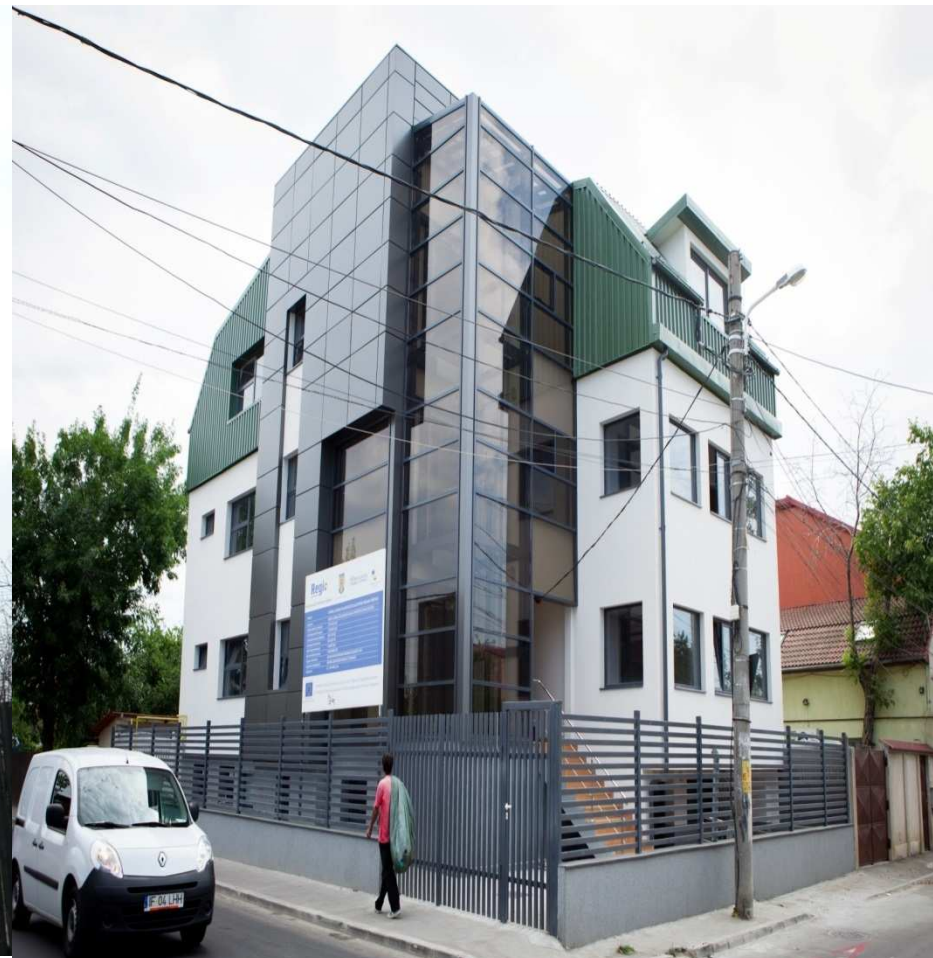
DGASPC SECTOR 2 Centrul de servicii de asistenta sociala pentru persoane varstnice