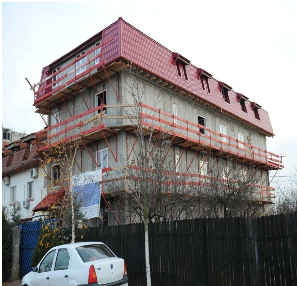
FUNDATIA SFANTA IRINA Cancerul, prioritate absoluta- dezvoltarea unui sistem real de servicii sociale