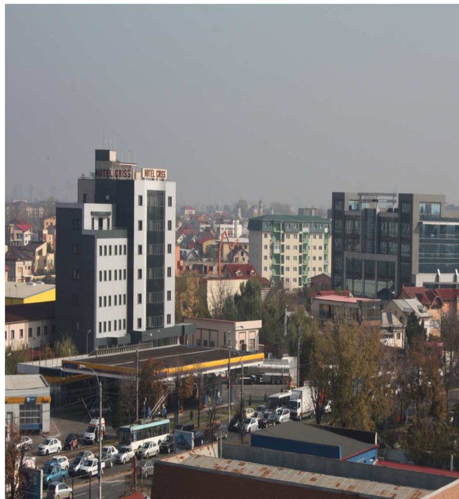
Hotel CRISS - Bucuresti