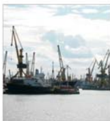
Profit de 1,16 miliarde lei pentru SICIM Constanța