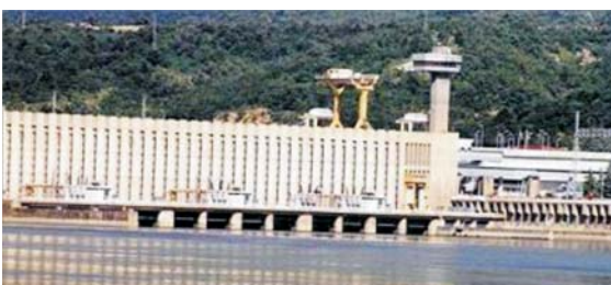
Specialiștii consideră investițiile în hidrocentrale ca fiind cele mai profitabile pe termen lung.

● Aproape 2,7 miliarde de euro ne sînt necesari ca să valorificăm energia ecologică ● Strategia Guvernului privind sursele regenerabile de energie a intrat în vigoare de la începutul acestui an ● Statul este pregătit să aloce o parte din fondurile necesare și să ofere scuturi de taxe investitorilor ● Utilizarea energiei ecologice conduce la o scădere considerabilă a importurilor de energie convențională