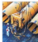
"Shell" sperie piața petrolieră