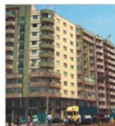
Zăpada și gerul au scăzut chirurile în Capitală