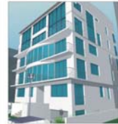
"P&G Group" derulează investiții imobiliare de peste 30 milioane de dolari