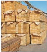
Producția de export a "Sigstrat" Sighetu Marmatiei: 3 milioane dolari pe an