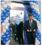
"Labelon România" și-a deschis o nouă fabrică