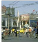
China înregistrează cea mai mare creștere economică a ultimilor șase ani