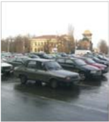
Piața autovehiculelor noi a crescut cu 21%