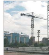
Contestatarii licitațiilor publice își caută dreptatea la Uniunea Europeană