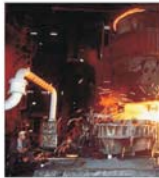
Specialiștii "Promet" au realizat peste 1000 de inovații și peste 300 de invenții