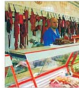
Consumul de alimente a crescut în 2003