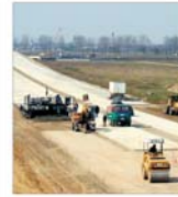
Grupul "Contransimex" a ajuns la mina creditorilor